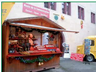
Notre cabanon du Père Noël devant le musée de la Communication.