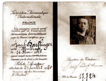
Brevet international de pilote obtenu le 20 juillet 1920.

Il est licencié en 1933 parce qu'il n'est toujours pas citoyen américain. Il le devient en 1936. De 1937 à 1943, il entre comme instructeur au sol dans une école privée de l'État de Milwaukee (Wisconsin, États-Unis) puis au service d'un club de chasseurs et de pêcheurs. Ce dernier emploi sera « le plus drôle et le mieux payé qu'il ait jamais eu ».