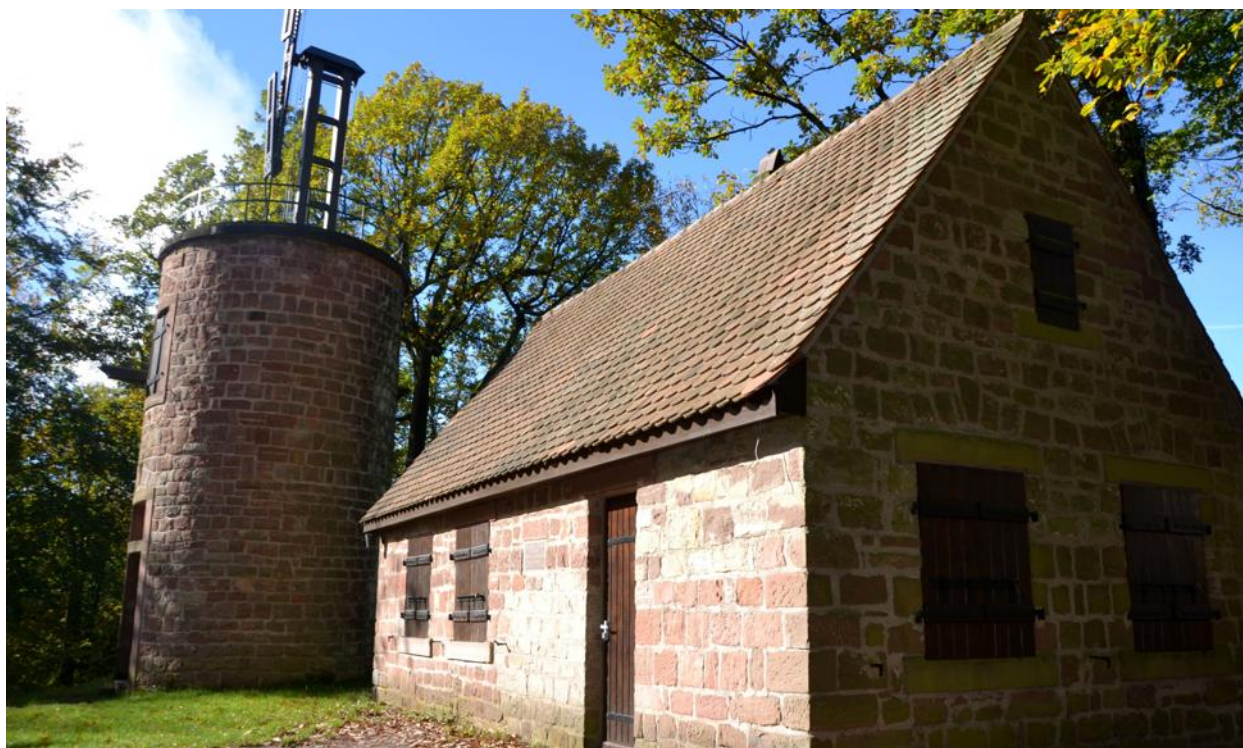
Reconstituée en 1968, la tour Chappe de Saverne est « dans un état impeccable »