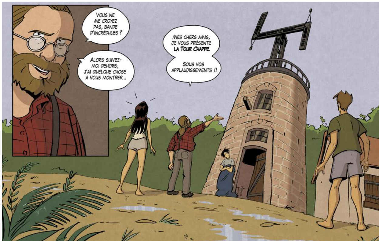
Un mystérieux homme va conter l'histoire de la tour Chappe à trois randonneurs égarés dans la forêt de Saverne.

La tour Chappe de Saverne se trouve au centre d'une bande dessinée (BD) éditée prochainement par la Société d'histoire de la poste et des télécoms en Alsace (SHPTA). Une façon amusante et ludique d'aiguiser ses connaissances sur le fameux télégraphe aérien français.